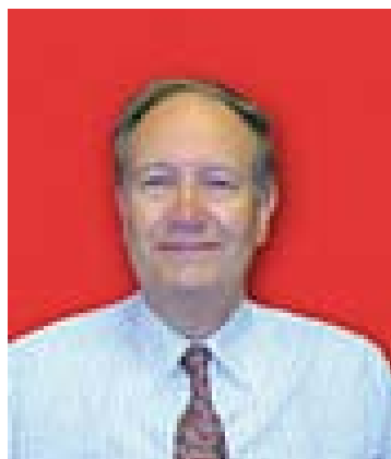
An Comh. Ruaraidh Moireach Cathraiche Comataidh Poileasaidh agus Stòrais

“Se a th’ann am Polasaidh, nuair a thig e gu a h-aon sa dhà, ach mar a tha sinn a’ cleachdadh stòrais. Se dleasdanas na Comataidh seo polasaidhean a dhealbh agus na prìomh ghnìomhan a cho-òrdanachadh. Tha mar a libhrigeas sinn na seirbheisean a’ crochadh air cho math ’s a làimhseachas sinn daoine agus ionmhas na Comhairle. Tha Comataidh Polasaidh agus Stòrais na Comhairle a’ gabhail an uallaich airson riaghladh polasaidhean agus dòighean-obrach a-rèir rianachd ar stòrais”.