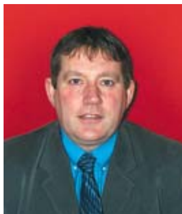
An Comh. Aonghas Caimbeul Cathraiche Comataidh Seirbhisean na Comhairle