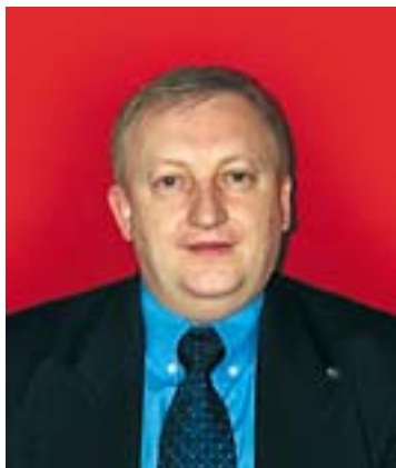
An comh. Seòras Loni Cathraiche Comataidh nan Seirbheisean Taigheadais