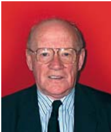
An Comh. Domhnall MacGill'ean Cathraiche Comataidh nan Seirbheisean Leasachaidh